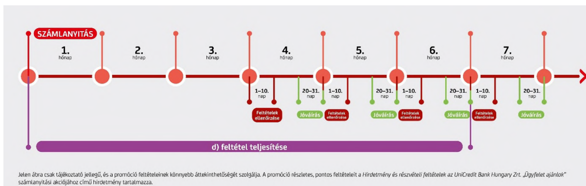
2. ábra: A d) feltétel teljesítése, vizsgálata és jóváírása

Visszaméréskor 3.1.2 pontban leírt valamennyi feltételnek teljesülnie kell. Amelyik hónapban teljesül a Lakossági Ajánlott által a d) feltétel, annak a hónapnak a 20. és utolsó munkanapja között történik meg a jóváírás mind az Ajánló, mind az Ajánlott számláján.