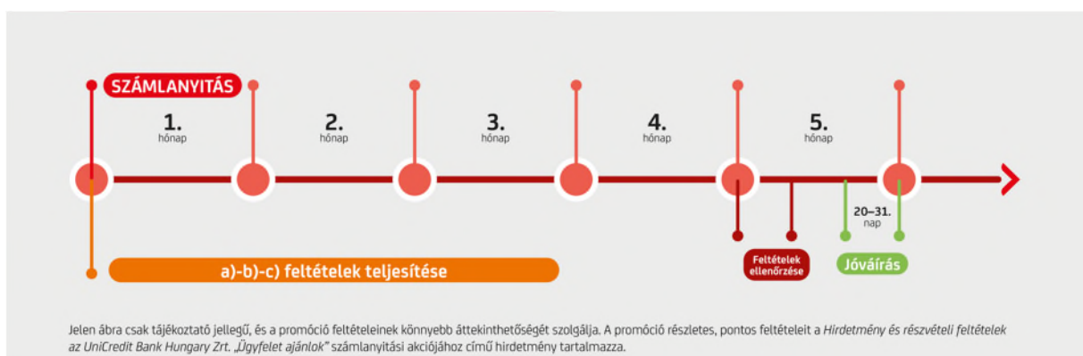
1. ábra: A 3.1.2. pontban részletezett a)-b)-c) feltételek teljesítése, vizsgálata és jóváírása

A 3.1.2 pontban részletezett a)-b)-c) feltétel teljesítésére a számlanyitástól számított 4. hónap utolsó munkanapjáig van lehetősége az Ajánlott ügyfélnek, ahol az 1. hónap a számlanyitás napjának a hónapja. A Szervező az a)-b)-c) feltételek szerinti jóváírásra való jogosultságot a számlanyitást követő 5. hónap első felében méri vissza.