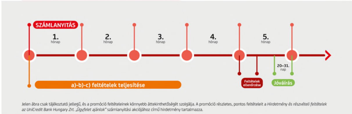
3. ábra: A 3.2.2 pontban részletezett feltételek teljesítése, vizsgálata és jóváírása